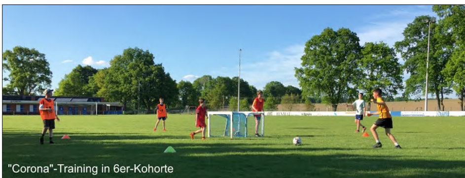
"Corona"-Training in 6er-Kohorte